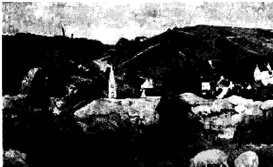
Immagini tratte dal web e utilizzate per finalità istituzionali

AZIENDA SANITARIA LOCALE RIETI Via del Terminillo, 42 – 02100 RIETI – Tel. 0746 2781 Codice Fiscale e Partita IVA 00821180577 PEC: dipartimento_prevenzione.asl.rieti@pec.it Servizi Veterinari